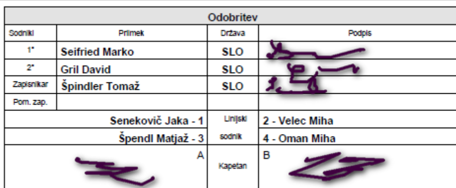
Slika 17 Potrditev rezultata tekme in zapisnika